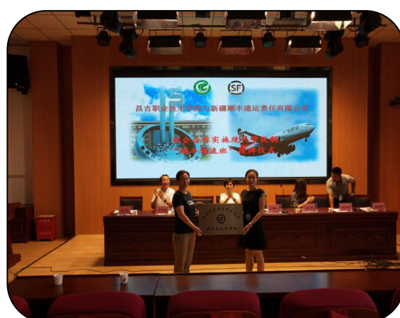
现代学徒制开班仪式