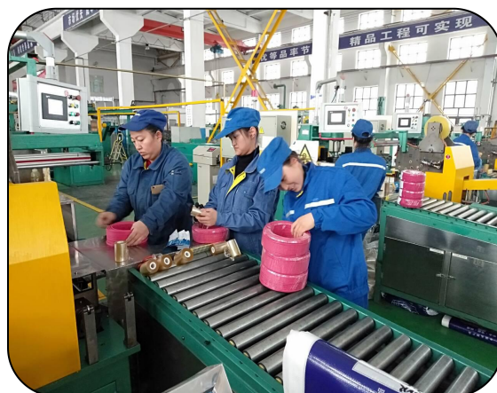
学徒向师傅学习二次配线原理