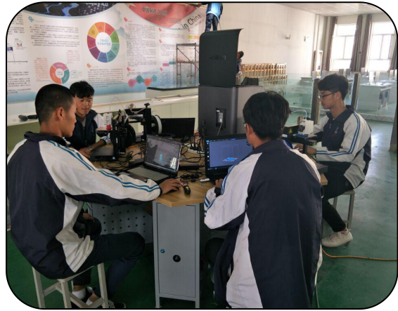
与武汉天之逸公司开展机器人、激光雕刻、3D 打印等智能、智慧前沿领域的合作 学生操作智能机器人与 3D 打印