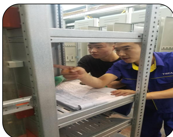
师傅向学徒讲解识图与检查工艺