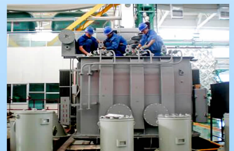
学生在特变电工订单就业