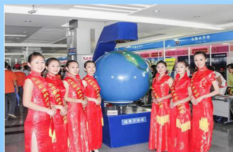
亮丽多彩的礼仪队