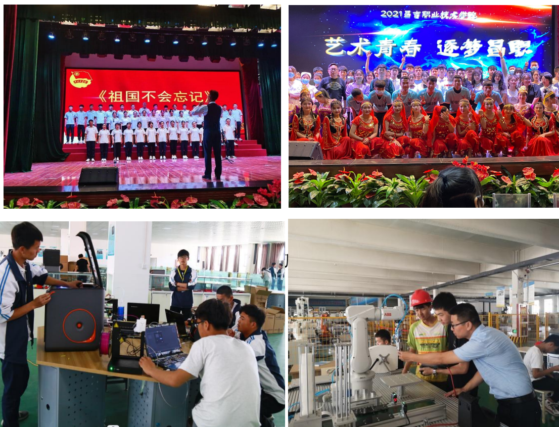
学生参加社团活动

分院现有班级 59 个、学生 2342 人，以培养具有“匠心精神+艺术素养”为目标，突出学生技能提升和素质培养。以”第二课堂”为载体，全面提高学生综合素质，成立“篮球、足球”、棋类、“君王演绎”、文学、轮滑滑板等兴趣社团，开展“强国有我、青春飞扬”篮球、足球比赛，“礼赞建党一百年，唱支红歌给党听”红歌大赛、“请党放心、强国有我”主题宣传教育活动，满足学生个性化需求。成立“工业机器人操作”、“自动化设备装调”、“激光加工与 3D 打印”、“液压与气动控制”等专业社团，常态化梯队式营造“劳动光荣、技能宝贵、创造伟大”的时代风尚和育人文化。